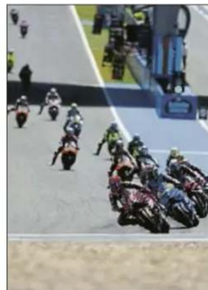
Marc Márquez Lideró giro y cuarto

y en la frenada de la 6 le superó. Marc acabó firmando en la curva 11 la quinta caída del año. Cayó en la trampa en una de las curvas favoritas de su hermano. No tenía ritmo en seco a lo largo del fin de semana, comparado con Alex Márquez o Fabio di Giannantonio, sus referentes Ducati, o Marco Bezzecchi, su referente Aprilia, y su carrera acabó an-