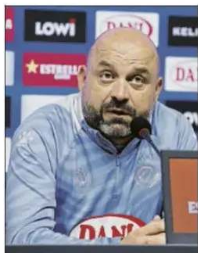
Manolo, convencido de salvarse

El Espanyol recibirá antes del pitido inicial una inyección de moral pues se ha organizado un multitudinario recibimiento al autocar del equipo por parte de una hinchada que siempre ha sido decisiva cuando su equipo ha disputado partidos de alta exigencia. Y hoy es una 'final' en toda regla ●