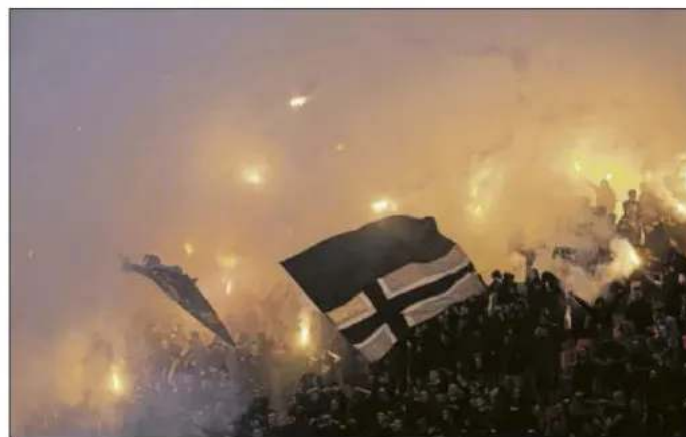
→ El derbi de Belgrado. Imagen de la afición del Partizan durante el partido ante el Estrella Roja en la liga serbia