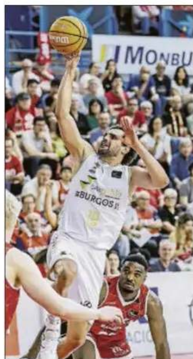
Neto no servía para el Barça

En un desenlace agónico, el Granada mostró carácter para forzar un empate a 82. La precisión desde la línea de tiros libres decidió el encuentro a favor de los locales, quienes resistieron la última ofensiva andorrana, con un triple final para forzar la prórroga que no acabó entrando