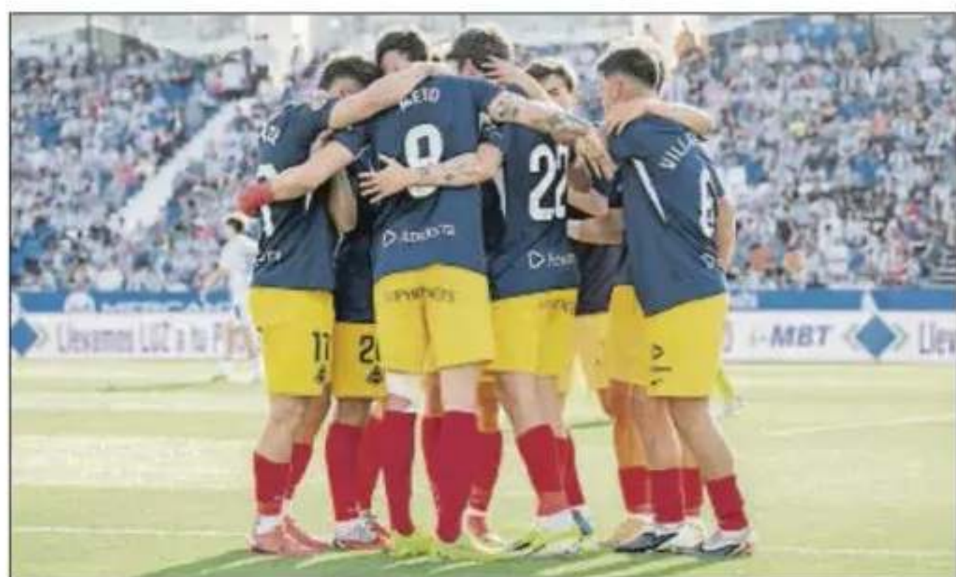
Los jugadores del Andorra, celebrando uno de los goles de ayer en Butarque