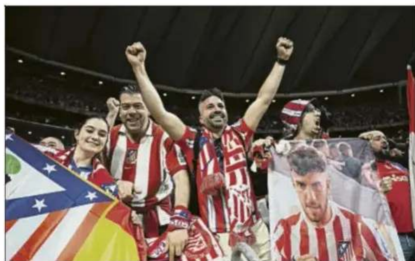
Los aficionados colchoneros convertirán el Metropolitano en una olla a presión

"La gente podría pensar que no se cuida. Pablo todos los días trabaja duro, cuida su alimentación, se preocupa por su descanso... Son cosas que pasan en la vida y en el fútbol", señaló Álex Baena ●