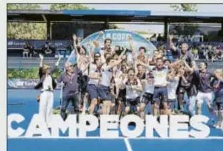
El Polo ganó la Copa del Rey