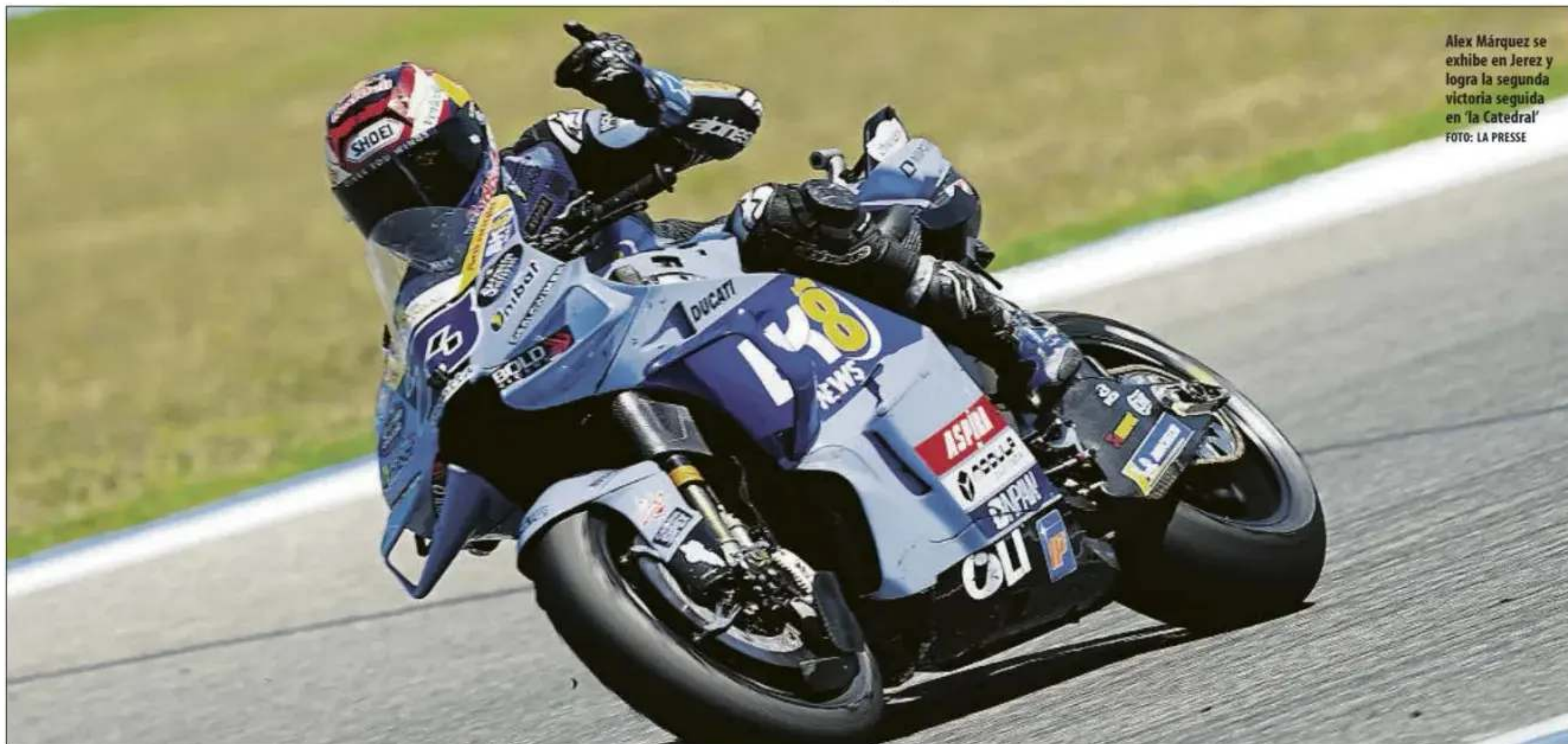
Alex Márquez se exhibe en Jerez y logra la segunda victoria seguida en 'la Catedral'