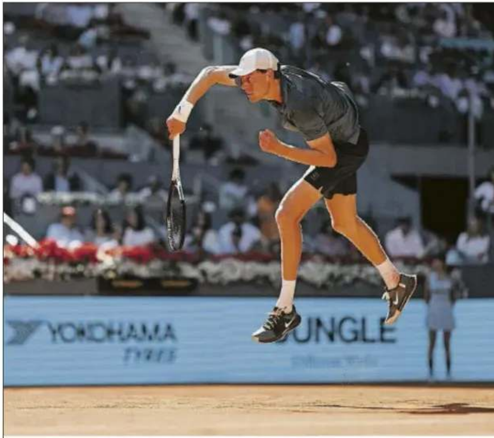
Salto acrobático de Jannik Sinner en el saque. Ganando altura y enseguida metido en pista

Sinner sigue sumando víctimas, acumulando puntos de ranking para alejarse cada día más del le-