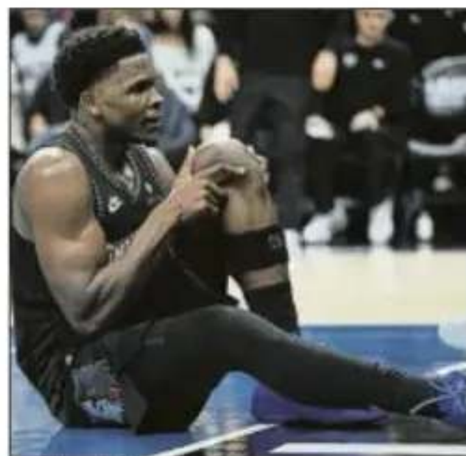
Anthony Edwards

En ese intento, Edwards apoyó mal la rodilla y se fue de inmediato al suelo, dejando mudo el pabellón y haciendo saltar las alarmas.