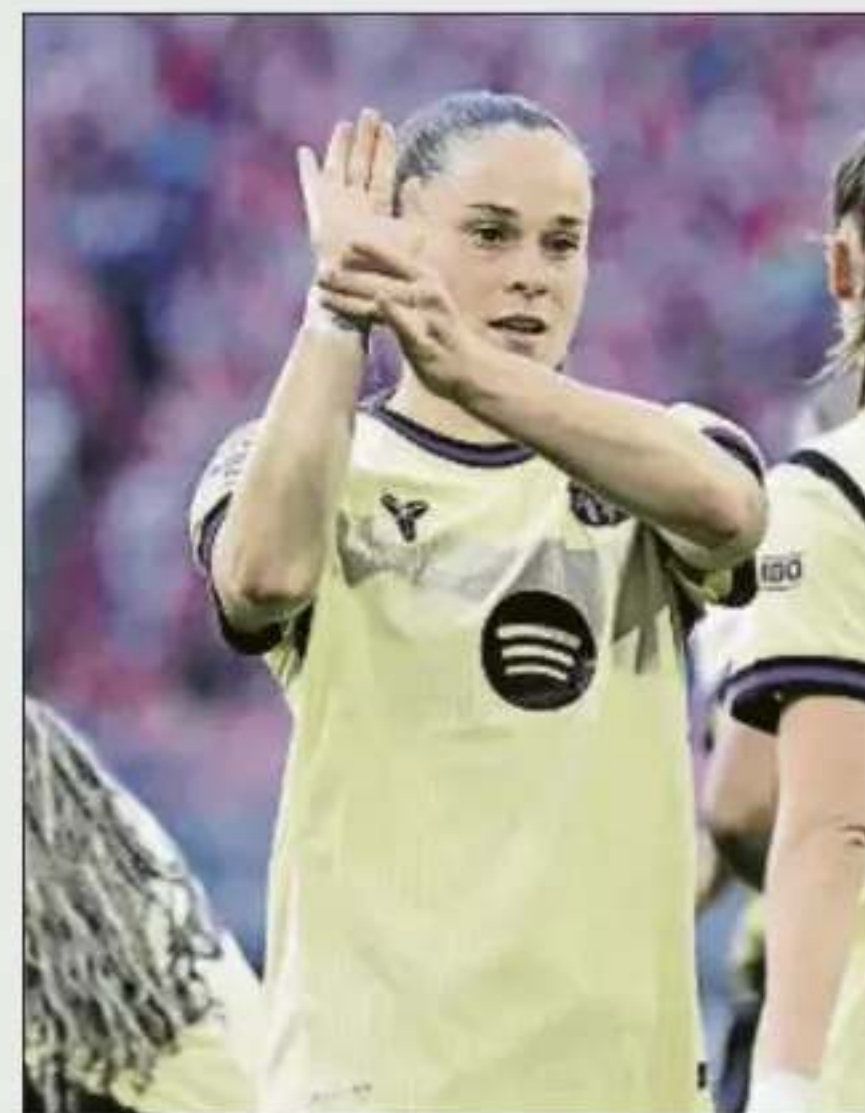
Ewa Pajor y su dedicatoria especial

Pajor mostró a la cámara un mensaje que tenía en su muñeca cuando marcó en Múnich. Se leía ‘Fighters’ (luchadores en inglés). Dedicó el tanto a la fundación contra el cáncer que lleva este nombre ●