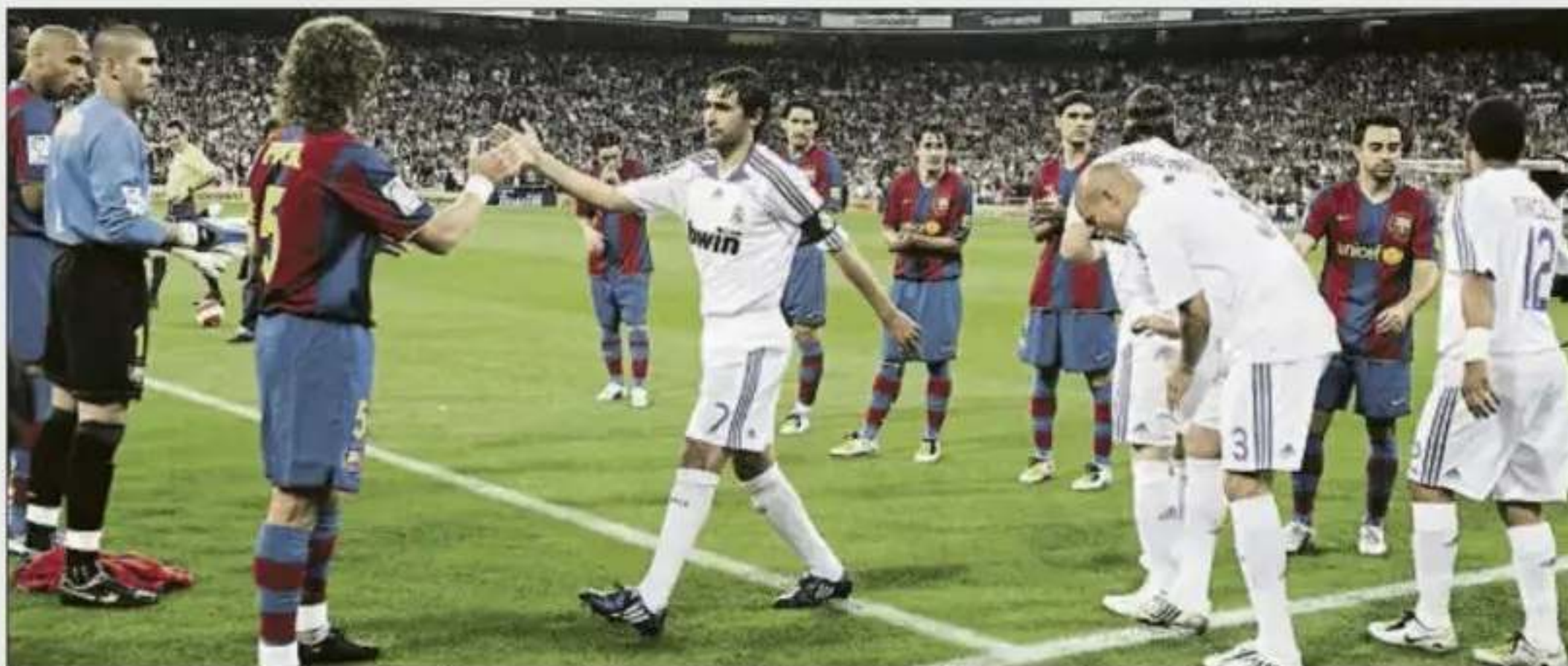
Pasillo del Barça al Madrid (Bernabéu, 7 mayo 2008)