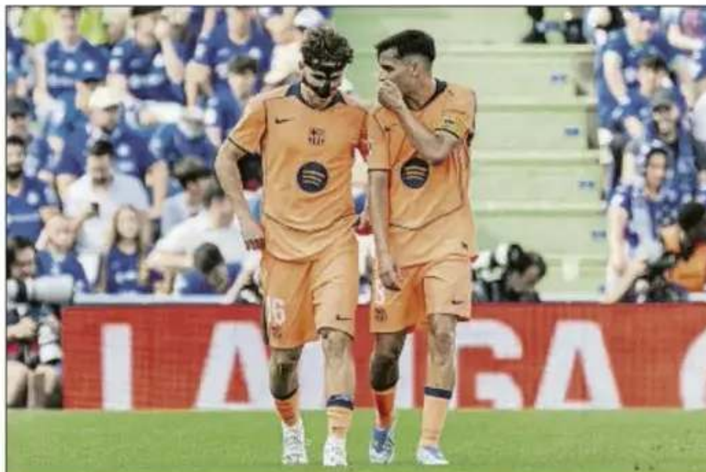
Una dupla de oro Pedri asistió a Fermín para abrir el marcador ante el Getafe

A su habitual control de los registros del partido, Pedri está cerca de superar esta temporada sus mejores cifras de influencia de gol, paradójicamente el curso en el que menos los ha marcado personalmente, con dos. Con su pase a Fermín en el 0-1 sumó su undécima asistencia de la campaña, listón que no había alcanzado en su carrera, y ya acumula 13 participaciones directas de gol. Su récord son las 14 que logró la temporada anterior, cuando aportó seis tantos como autor y ocho como asistente. Eso sí, lo hizo empleando mucho más tiempo en la cancha: 4.647 minutos en 59 partidos, por los 2.798 que suma ahora mismo en 39 duelos. Tiene, por lo