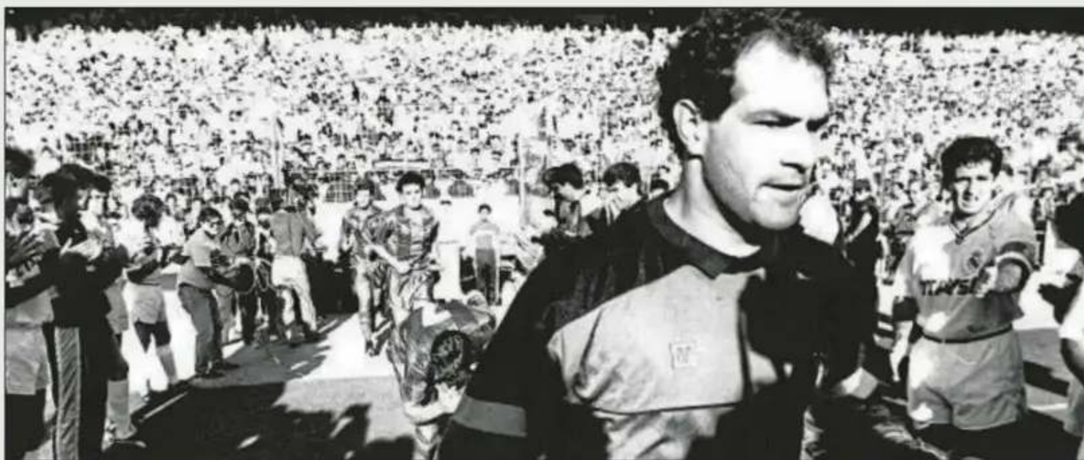
Pasillo del Madrid al Barça (Bernabéu, 8 junio 1991)