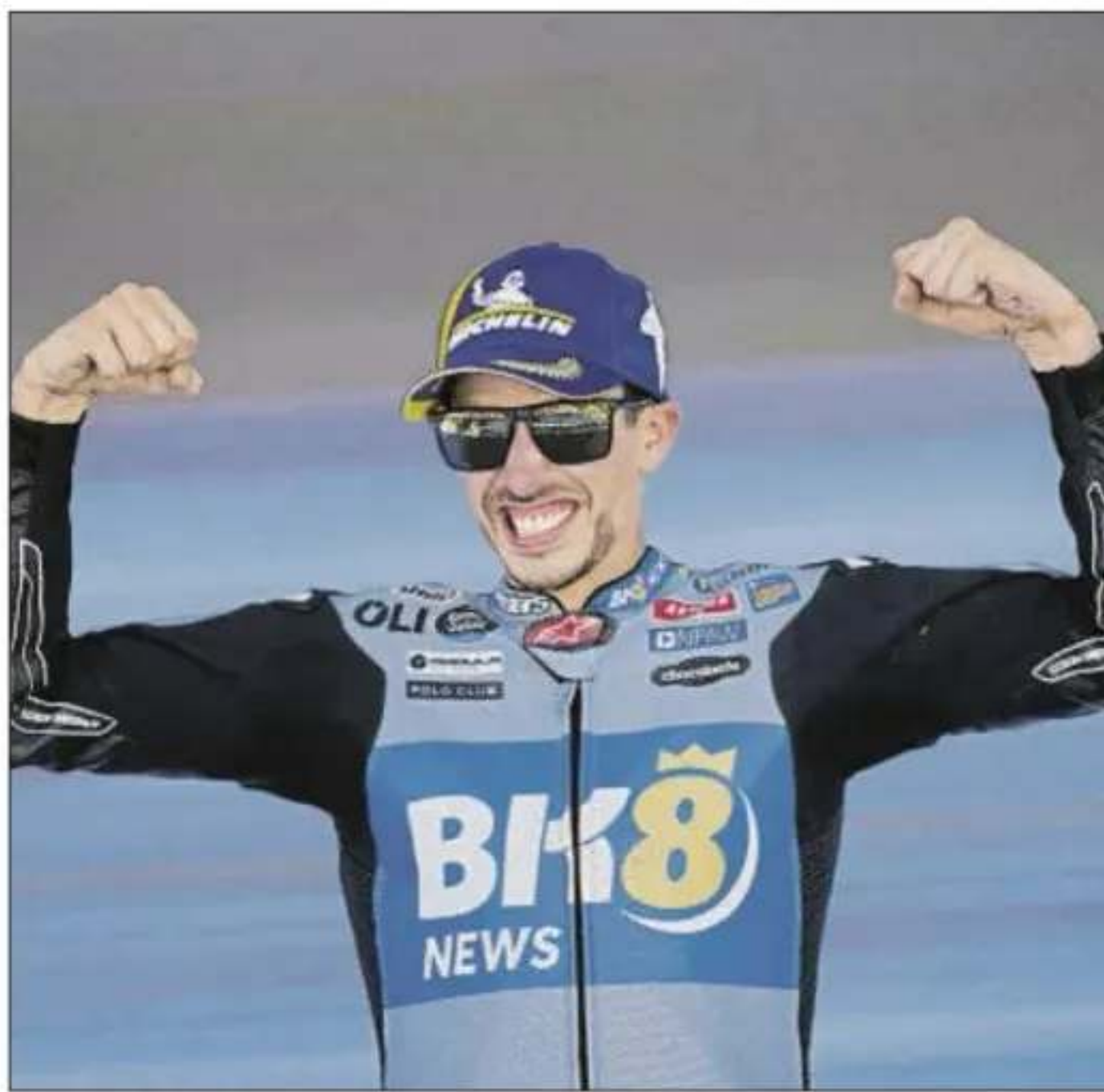
Alex Márquez saca músculo en Jerez

Marc lanzó un piropo a Alex en su 'scrum' al asegurar que hacía las curvas de izquierdas como él: "Es la diferencia con años anteriores o con el año pasado, aquí él tenía una o dos décimas más y lo hacía en las curvas a izquierdas, sobre todo, la 4 y la 8. Y