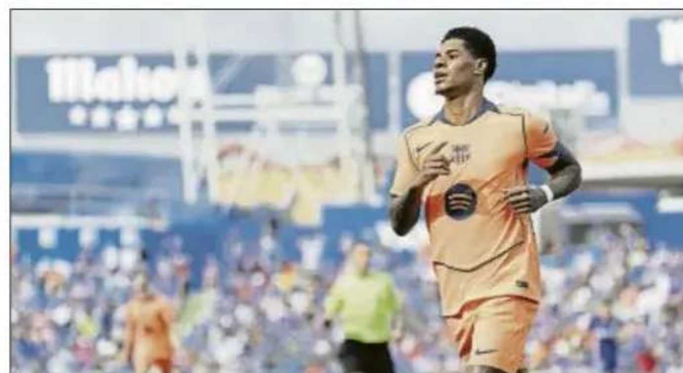
Rashford fue el autor de uno de los goles en Getafe.

El delantero inglés lo ve factible y considera que está acumulando méritos suficientes. Sus estadísticas personales le dan valor. Ha contribuido a la productividad goleadora del Barça participando en 26 goles en 2.333 minutos, 13 marcando, 11 asistiendo y en otro par provocando el penalti. Sale a una intervención cada 89 minutos, ra-