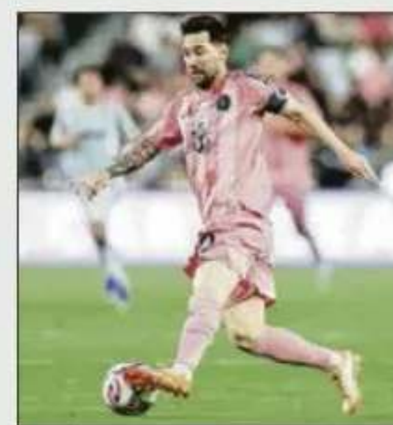
Messi no vio puerta