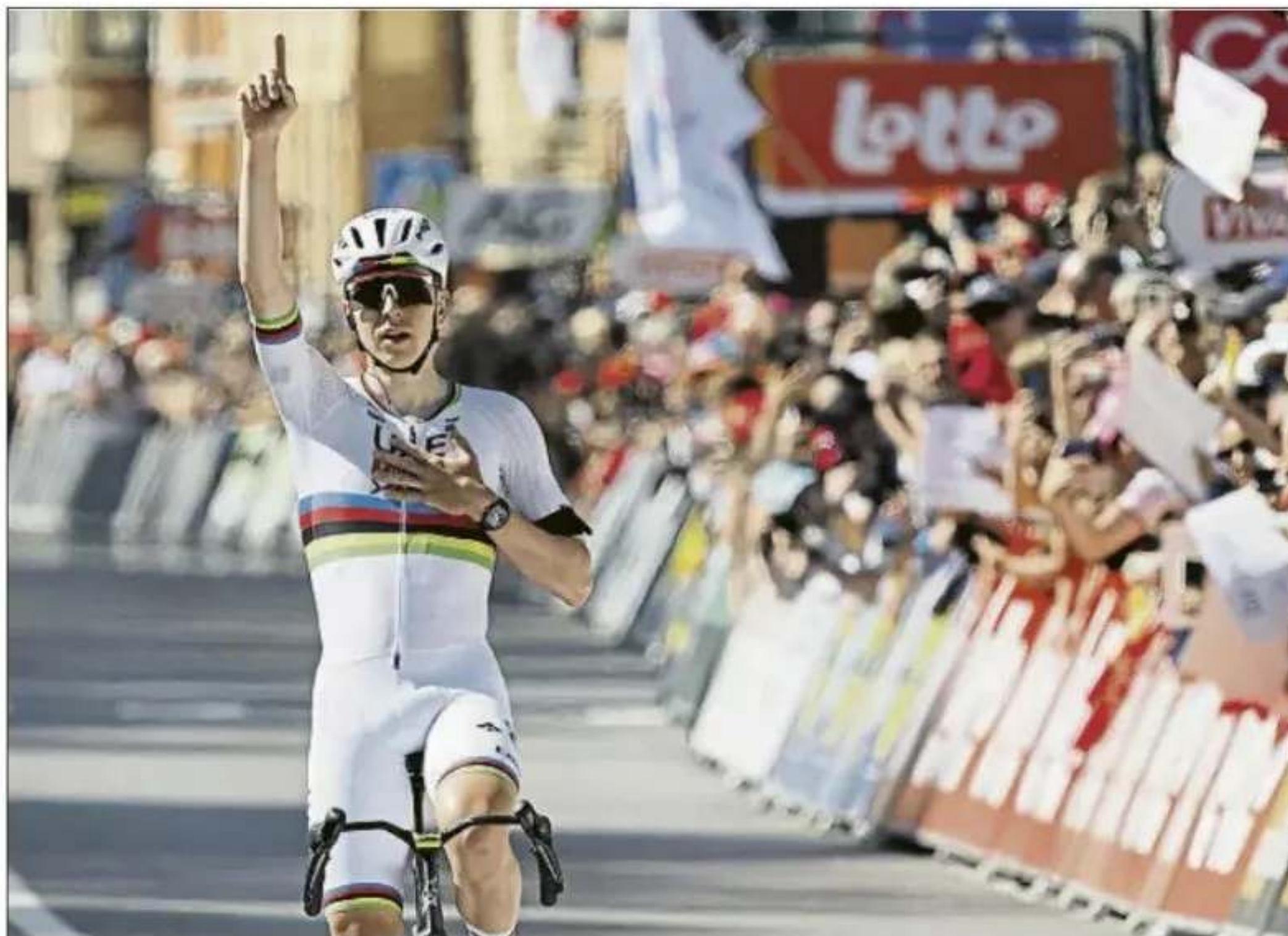
Pogacar lució un brazalete negro en recuerdo a su ex compañero Cristian Camilo Muñoz, a quien dedicó la victoria en Lieja

al 9,4% de pendiente media en el que Pogacar había cimentado sus victorias los dos años anteriores. Fiel a la tradición, 'Pogi' atacó en las primeras rampas de La Redoute, a 35 kiló-