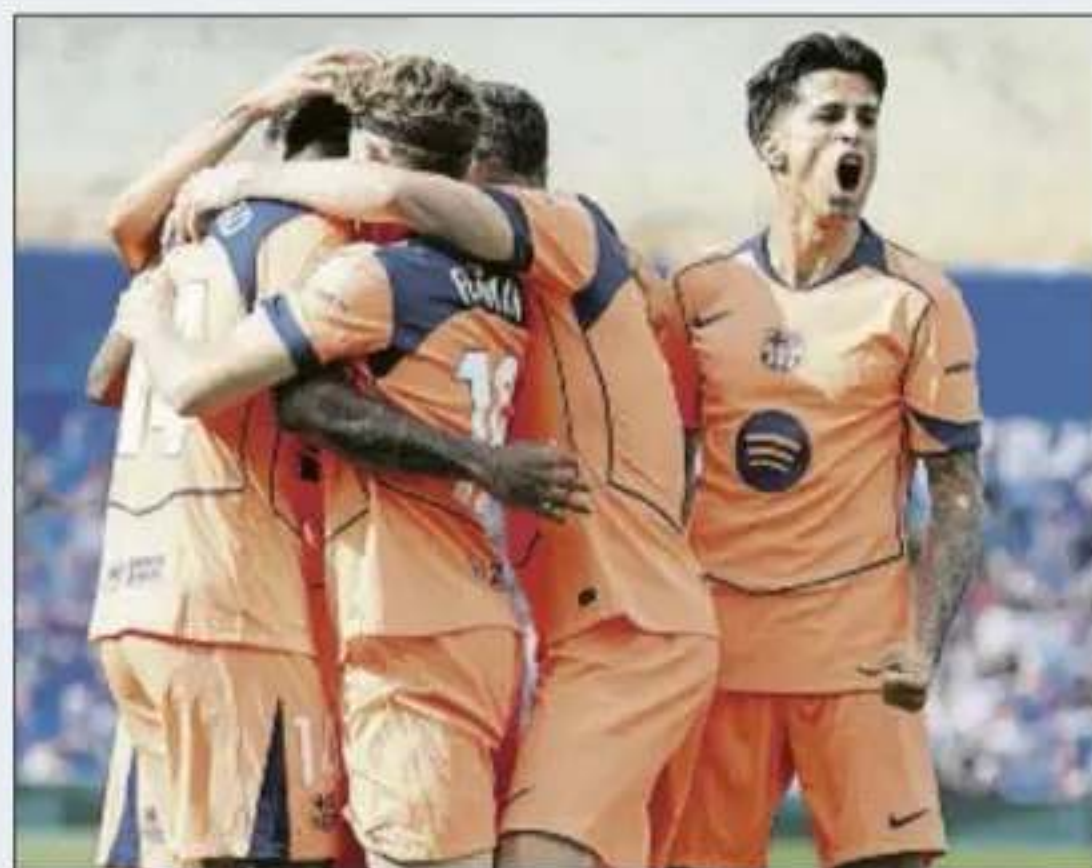
El Barça dej3 casi sentenciada la Liga en Getafe

Desde hace un tiempo da la impresi3n de que muchos clubs o no cuidan bien su f3tbol base o no tienen posibilidades econ3micas para reforzarse o no se saben mover para traer a futbolistas que llamen la atenci3n y que beneficien el espect3culo. Sucede que Inglaterra, que durante muchos a3os ten3a pr3cticamente prohibido fichar a futbolistas que no fuesen del Reino Unido, ahora se ha convertido en multinacionales que captan a los j3venes que apuntan en cual-