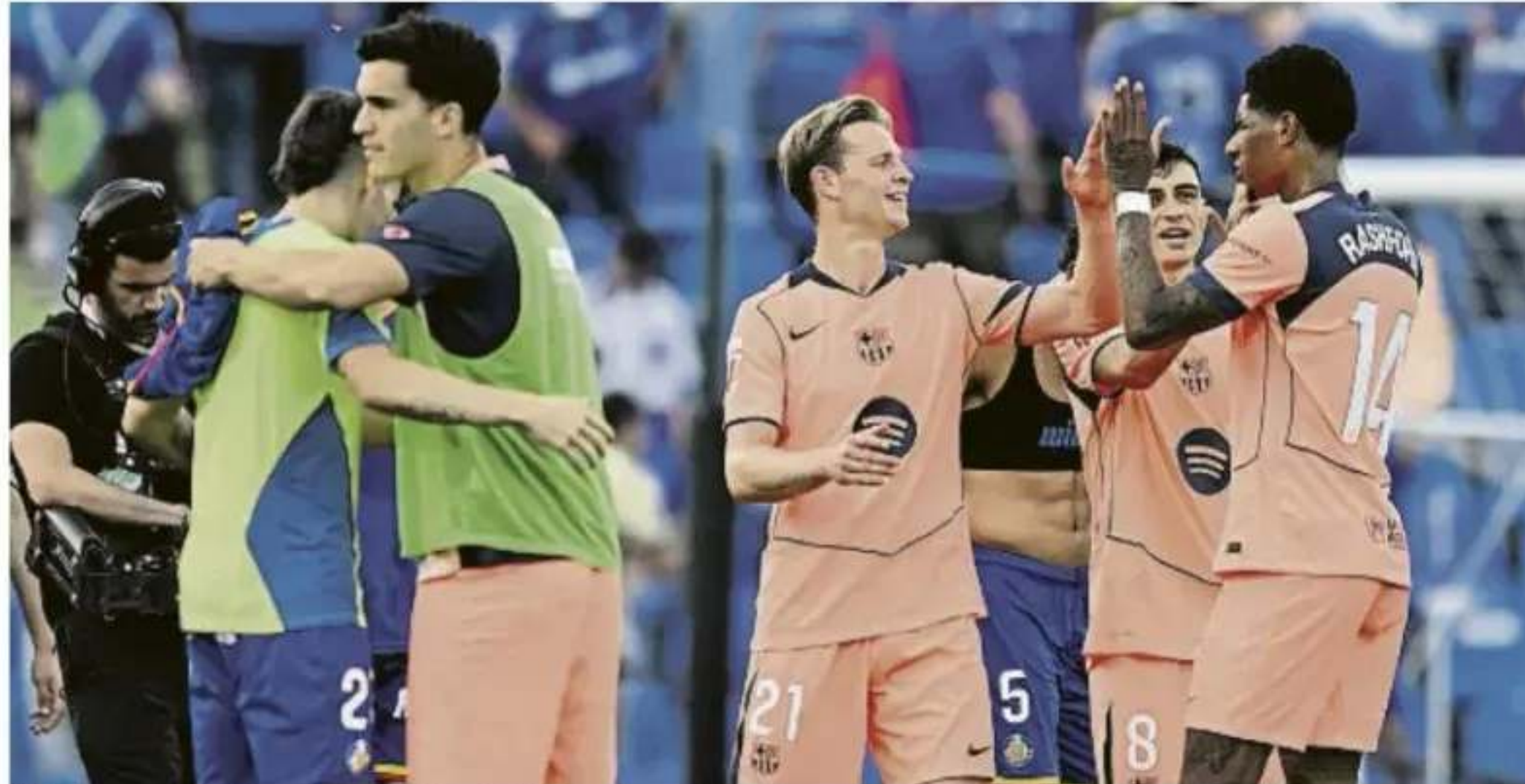
El Barça rompió el gafe que le perseguía en Getafe. Tras cinco partidos sin ganar, los de Flick consiguieron imponerse a los azulones.

El plan de Hansi Flick salió a la perfección y el Barça dio la vuelta a las expectativas del partido: la teoría decía que el Barcelona dominaría territorialmente al Getafe y que los azulones tratarían de explotar los espacios a la espalda de la zaga barcelonista con balonzos a su punta. Fue al revés. El Barça no tuvo reparos en minimizar espacios cerca de su área y en aprovechar que el Getafe se atreviese a avanzar líneas. Por ahí se movió Fermín como pez en el agua, llegando desde la segunda línea, y Pedri puso en juego su tiralíneas para aprovechar esos espacios. Y así galopó Rashford hacia el 0-2 ●