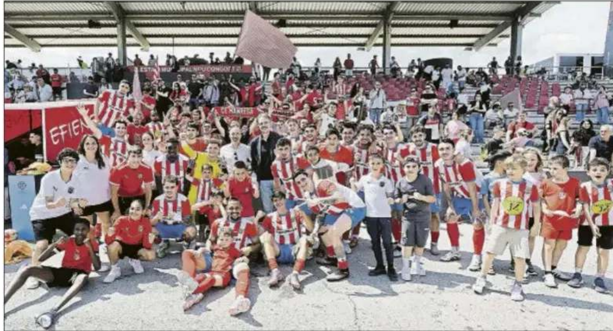
El Manresa celebró, en un Congost lleno, su importantísimo triunfo ante el Badalona que a la postre le valió el título de liga