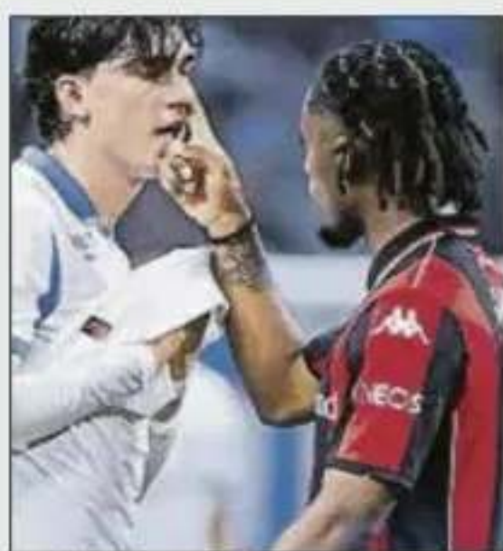
Wahi (d) frustró a su ex equipo