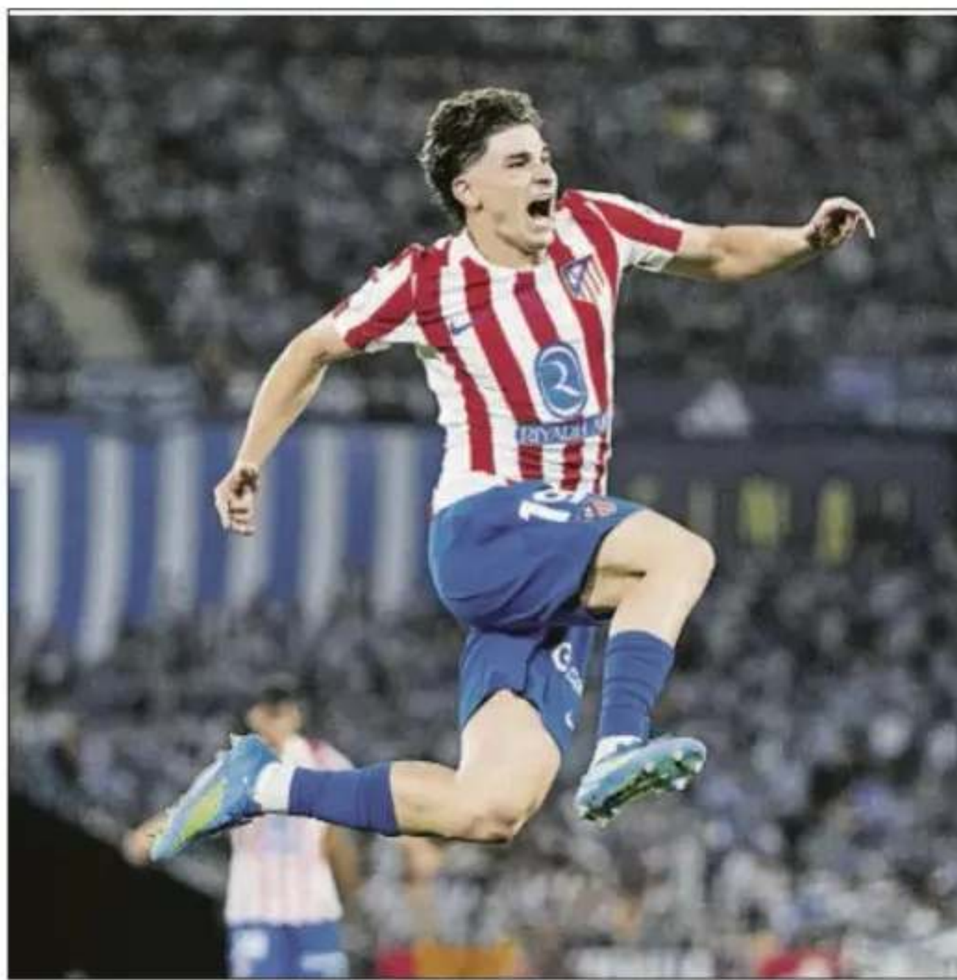
El delantero argentino está entre algodones tras un calendario cargado

La Champions es la competición fetiche del argentino. En la