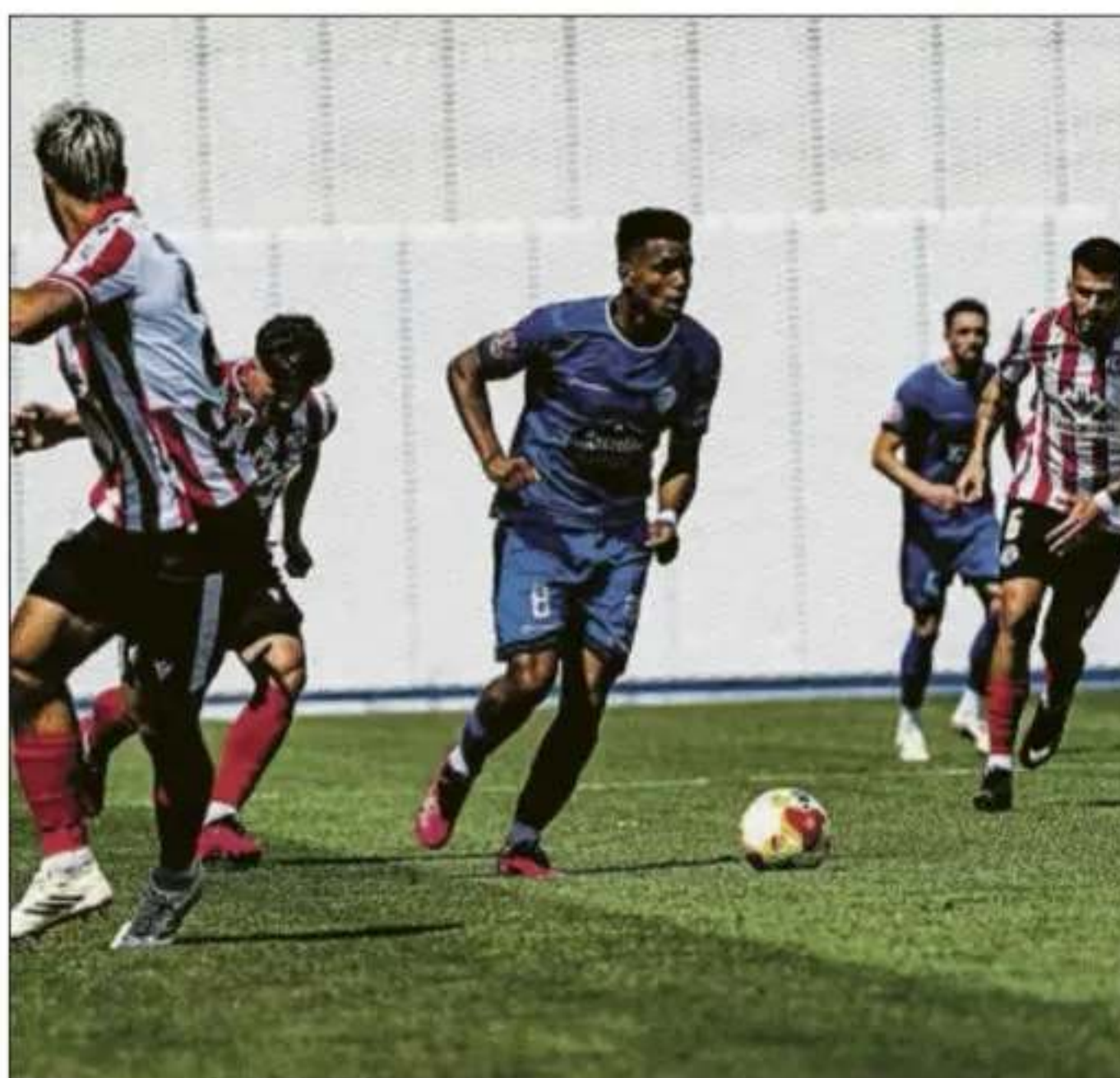
El Ourense perdió en O Couto frente al Zamora