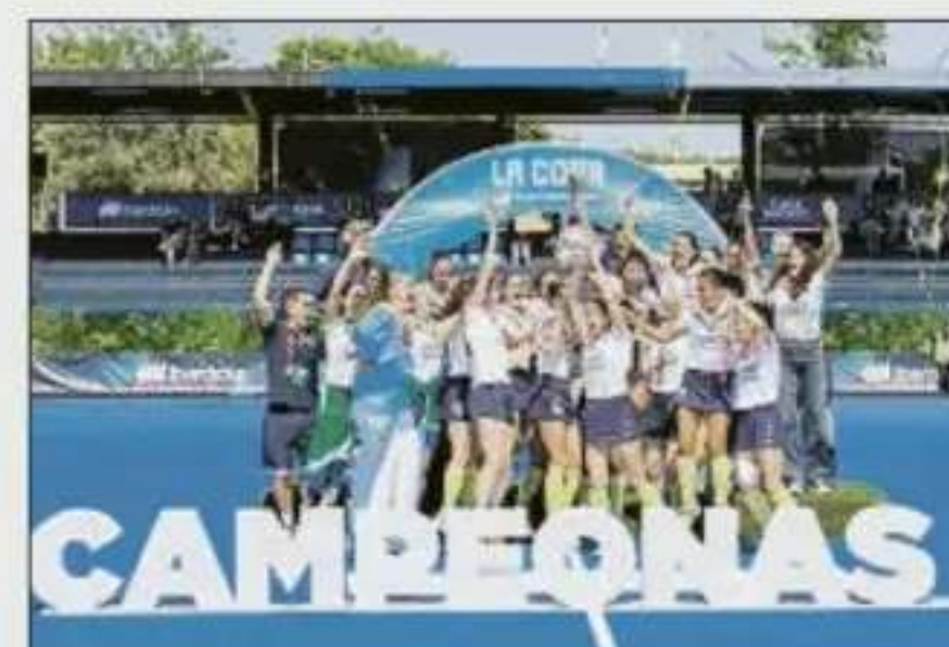
Copa de la Reina para el Club de Campo