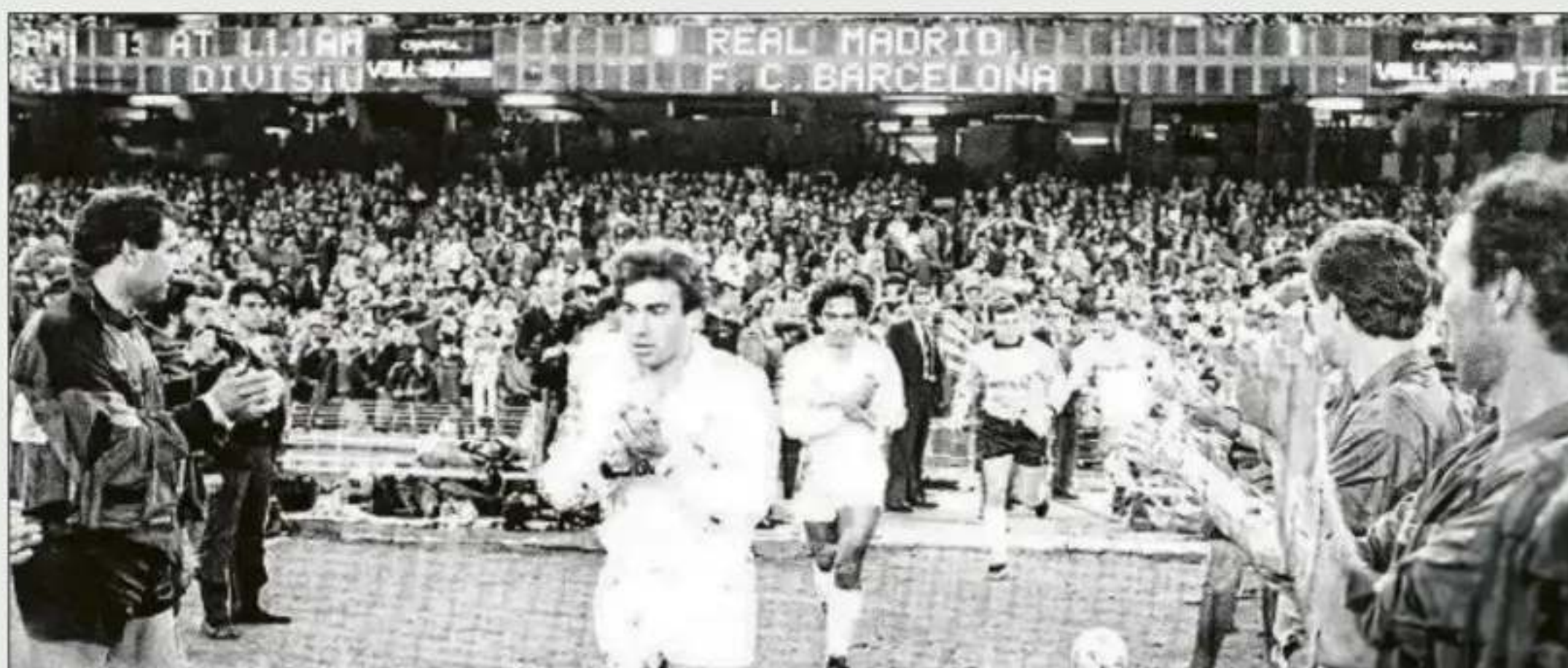
Pasillo del Barça al Madrid (Camp Nou, 30 abril 1988)

Todo este enfoque 'filosófico' de la rivalidad es la consecuencia del espectacular sprint que el Barça ha protagonizado para dejar 11 puntos atrás al Madrid. En apenas 69 días, el equipo de Hansi Flick ha cosechado 13 puntos más que los conseguidos por la plantilla de Álvaro Arbeloa, que llegó a ser líder el lunes 16 de febrero, coincidiendo con la derrota del Barça en Girona (2-1), en la 24ª jornada. Pero en las 9 jornadas posteriores, el pleno de puntos del Barça, 27 sobre 27, contrasta con los 14 puntos sobre 27 cosechados por el relevo en el banquillo de Xabi Alonso, quien dejó su silla a 4 del Barça. Así se explica, cronológica y numéricamente, el 'demarrage' que en la Liga ha protagonizado el líder y que hace viable la pregunta que hay en el barcelonismo: ¿Pasillo o alirón? •