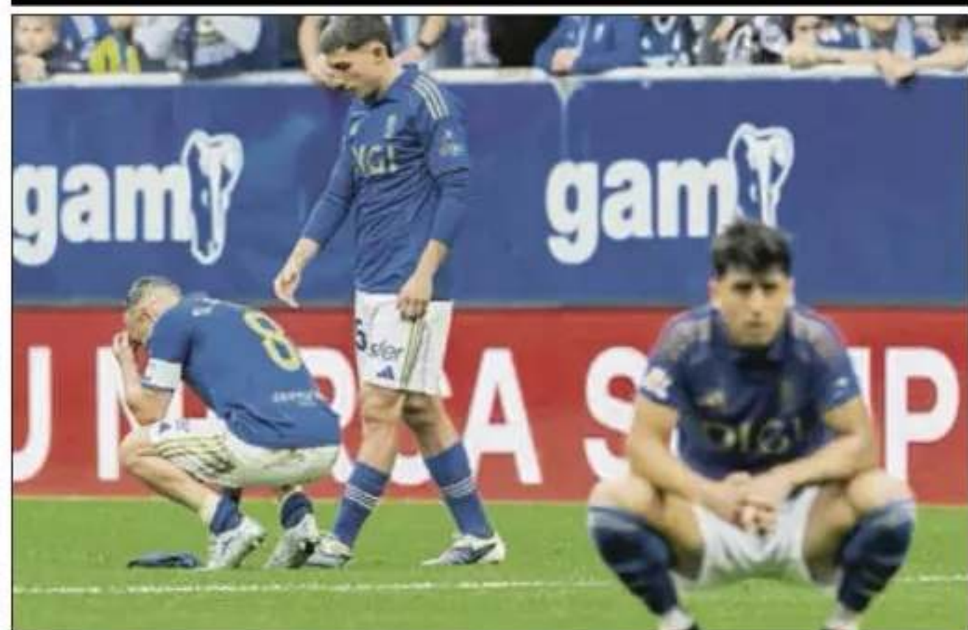
Los jugadores del Real Oviedo, cabizbajos ayer tras el partido