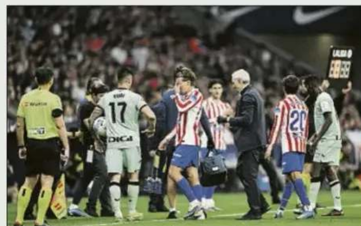
El canterano colchonero se fue desolado tras volver a lesionarse

En datos globales, son 40 las apariciones de La Araña en Champions, donde ha hecho 24 dianas, siendo el futbolista argentino que menos citas necesitó para alcanzar los 20 goles, superando a compatriotas como Messi o Agüero ●