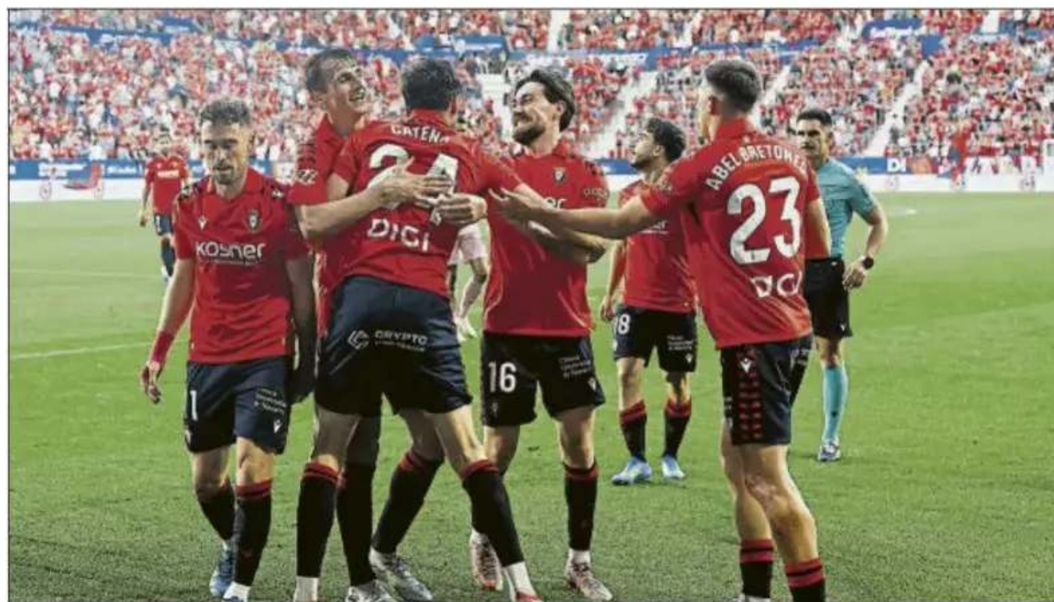
Agónico triunfo gracias al gol del central de Osasuna en el tiempo añadido de un duelo que fue en líneas generales igualado

la salida de Raúl García fue crucial. En el 81, el ex bético aprovechó una buena maniobra de Budimir para poner el empate de los rojillos, que apretaron en los minutos finales mucho mientras los nervionenses se metían atrás. Vlachodimos mantuvo al Sevilla en pie, al menos con la posibilidad de sumar un punto, con parados ante Budimir y Raúl García, pero en la última jugada de la prolongación Catena llevó la alegría a El Sadar, que ve cómo los suyos se escapan del peligro, y meten de lleno en el fango a un Sevilla hundido y que tiene un calendario difícil, en el que se agarra a dos partidos en casa ante Real Sociedad y Espanyol ●